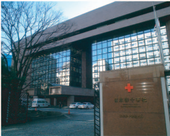
日本赤十字社 本社ビル外観

『NMRパイプテクター』が、全国的に普及したきっかけとなる、日本赤十字社広尾医療センターでの効果実証につづき、日本赤十字社本社ビルの空調配管でも、効果が実証されました。 広尾医療センターでの結果が評価され、日本赤十字社の院内報にも結果掲載されたことから、日赤関連施設では2番目となる日本赤十字社本社ビルに、平成14年3月、『NMRパイプテクター』が設置されました。 日本赤十字ビルは築24年が経過しており、配管は亜鉛めっき鋼管を使用してい