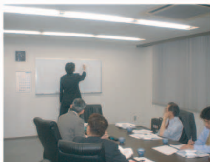
■7月11日(金)の技術セミナー(本社) ※次回の技術セミナー(本社)は、9月19日(金) 13:30~17:00です。

参加・開催をご希望の方は、お気軽に技術サービス部までお問い合わせ下さい。 (Email: gijutsu@spk.co.jp)