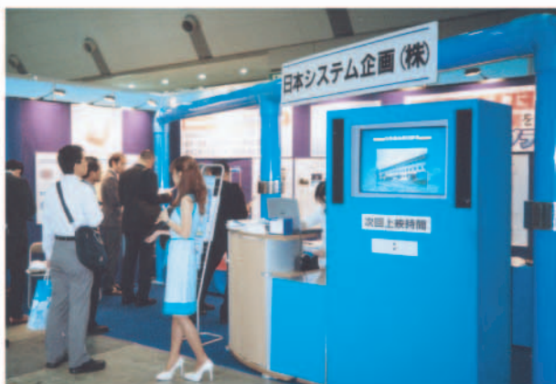
国際モダンホスピタルショーにて、注目を集める日本システム企画のブース

国際モダンホスピタルショーに「NMRパイプテクター」出品 医療・福祉施設の総合展『国際モダンホスピタルショー2003』が7月16日～18日、東京ビッグサイトにて開催され、昨年に続き「NMRパイプテクター」を出品しました。 最新の医療機器・システムが目立つ展示会場のなかで、病院施設における給水及び空調配管の赤錆対策として、「NMRパイプテクター」が注目を集め、3日間の合計で200人以上の方に「来場いただきました」。今回の展示会では、全国各地からの来場者が多く、長崎県からパイプテクターを見るために来場した病院長もいたほどです。 給水及び空調配管の赤錆問題を抱えている病院は想像以上に多く、数多くの来場者がパイプテクターの効果に関心を持っていました。マンシヨンの次に設置棟数を増やしている病院施設。今回の展示会でさらなる普及が期待できそうです。