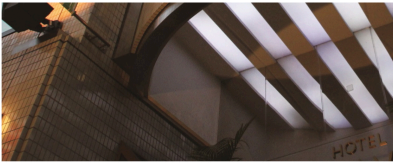
ホテルサップ渋谷