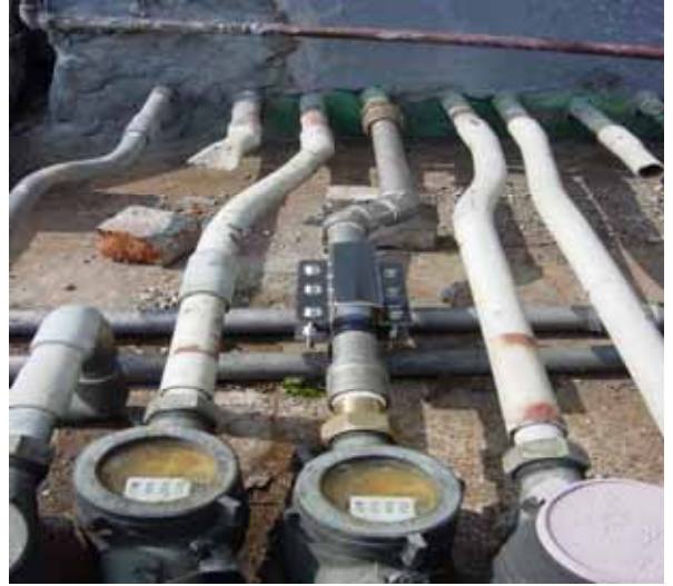
4F No.129 号室系統 PT - 30DS