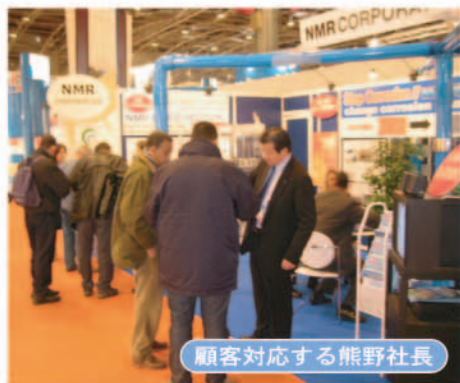
顧客対応する熊野社長