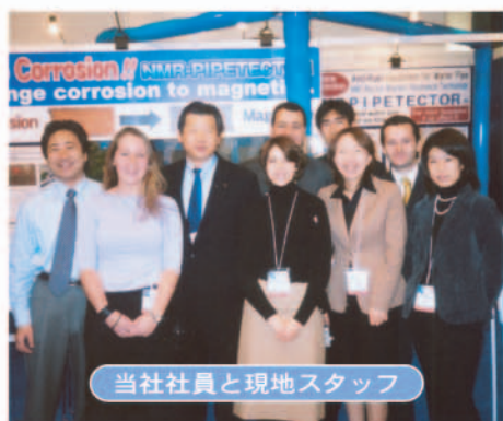
当社社員と現地スタッフ